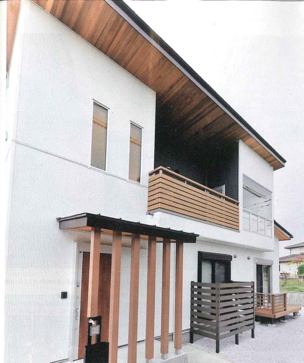
軒下の裏側に木材を張り巡らし、自然と調和した独特のシンプルモダンを実現。機能性と日当たりを重視したサンルームは、外観のアクセントにもなっている。玄関前に格子状に木材を並べたり、和室のそばに塀を設けて坪庭の風情を演出するなど、ほのかに和のテイストもプラス