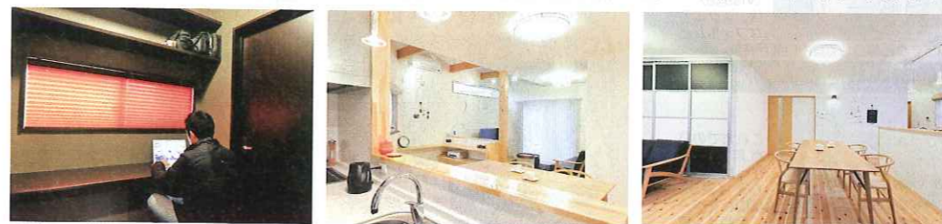
こだわりの書斎は黒いクロスで隠れ家風に。リビングの高窓からたっぷり日光が差し込む1階。パソコンデスクなど造作の家具も多い