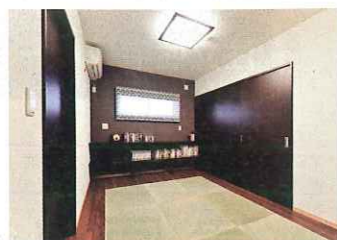
中央に琉球畳を敷き詰めた寢室。和モダンな雰囲気、くつろぎの時間を演出してくれる