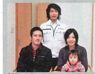
「設計から施工まで細やかにサポートしてもらい、安心して家づくりができました」

同世代の担当者はとても話しやすく、おかげでつい無理難題な要望や非現実的なアイデアも遠慮なくぶつけてしまったと笑いながら語る施主。「ロックライミングができる壁をつけてトレーニングルームに」「納戸にはつり橋を渡っていく構造にしよう！」など、アイデアが次々と湧き、打合せも楽しかった。