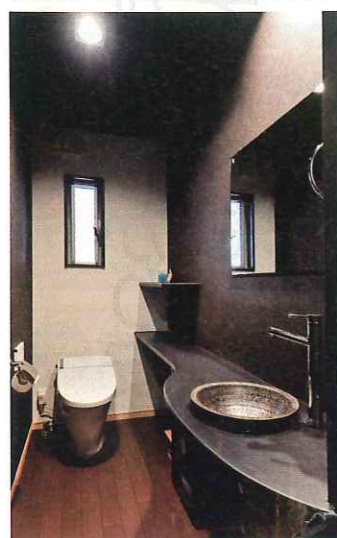
トイレスペースは、陶器の洗面ボウルとダークウッドの質感が相まった非日常的な空間