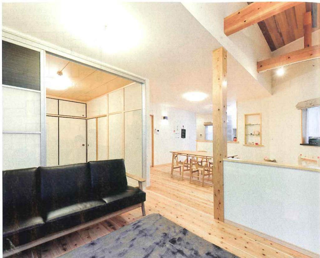
半分が吹き抜けとなっているリビングは同社からの提案。開放感がありながらも、冷暖房が効率的というダブルメリットがある。ダイニングの壁は、壁紙の下に鉄板を引いたマグネットウォール。画紙で壁を傷つけることなく雑誌やメモ用紙などを貼れる。部屋の中心はヒノキの柱