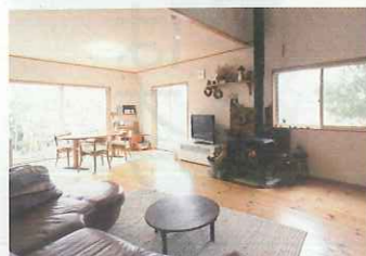
明るく開放的なLDK。造作棚に手作りリースを飾り、お気に入りの囲まれた暮らしが実現