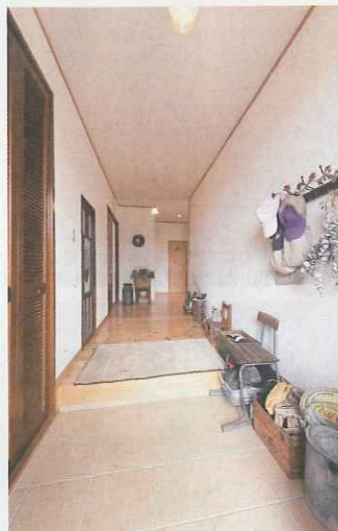
広々とした玄関の廊下には1つだけ背の低いドアが。古建具もじっくり馴染む空間だ

社ならではの、時代のニーズに合わせて進化を続け、地場でも評判だ。家づくりは設計から施工、引き渡しまで一貫して行うトータルサポート。すべて自社で施工し、施工主のこだわりを再現するだけでなく、実際に住んだときの暮らしやすさを考え、造り手自身も住みたくなる家を提案している。誠実かつハイセンスな同社の家づくり、ぜひ一度同社を訪れ、実感してほしい。