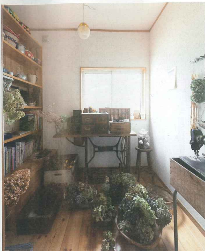
2階にはリース作りを趣味とする妻の部屋が。収納や本棚は造りつけて使いやすさを重視し、さらに床下には収納も確保。創作活動に没頭できるプライベート空間となっている