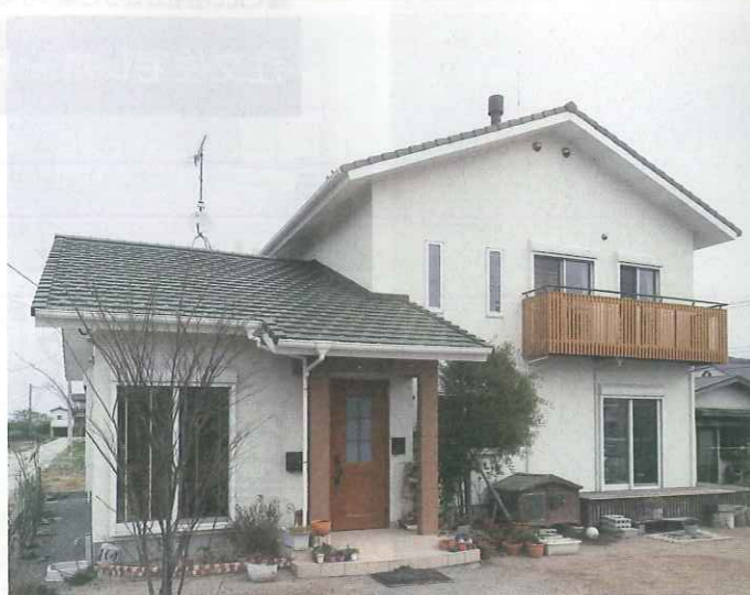
切妻屋根を1階部分と2階部分で垂直に配置し、各方向から見ても表情豊かな外観。2階のバルコニーの格子が、シンプルなデザインのアクセントになっている