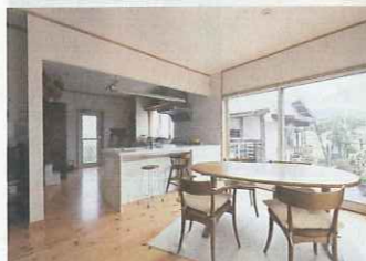
Hさんのこだわりで、キッチンは作業がしやすいL字対面式に。大きな窓の外の眺めも爽快