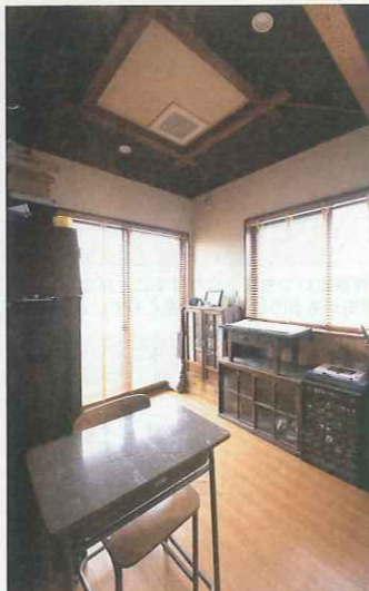
将来使うために床下にいるりを設けた夫の書斎。日本家屋を思わせる天井が粋な雰囲気